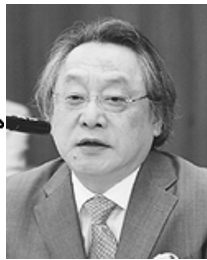
小林節 (せつ) 参考人 (慶應義塾大学名誉教授)